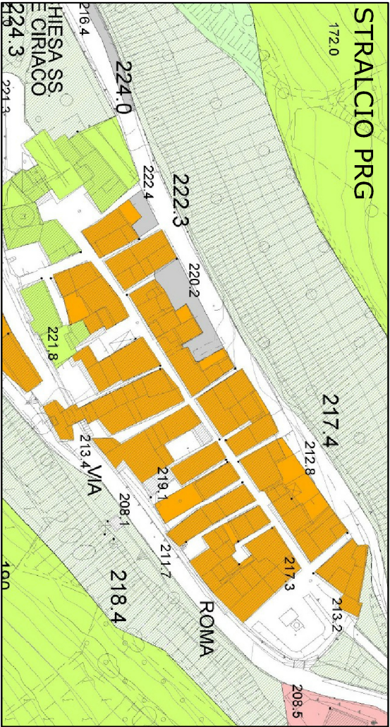
PLANIMETRIA GENERALE scala 1:1000