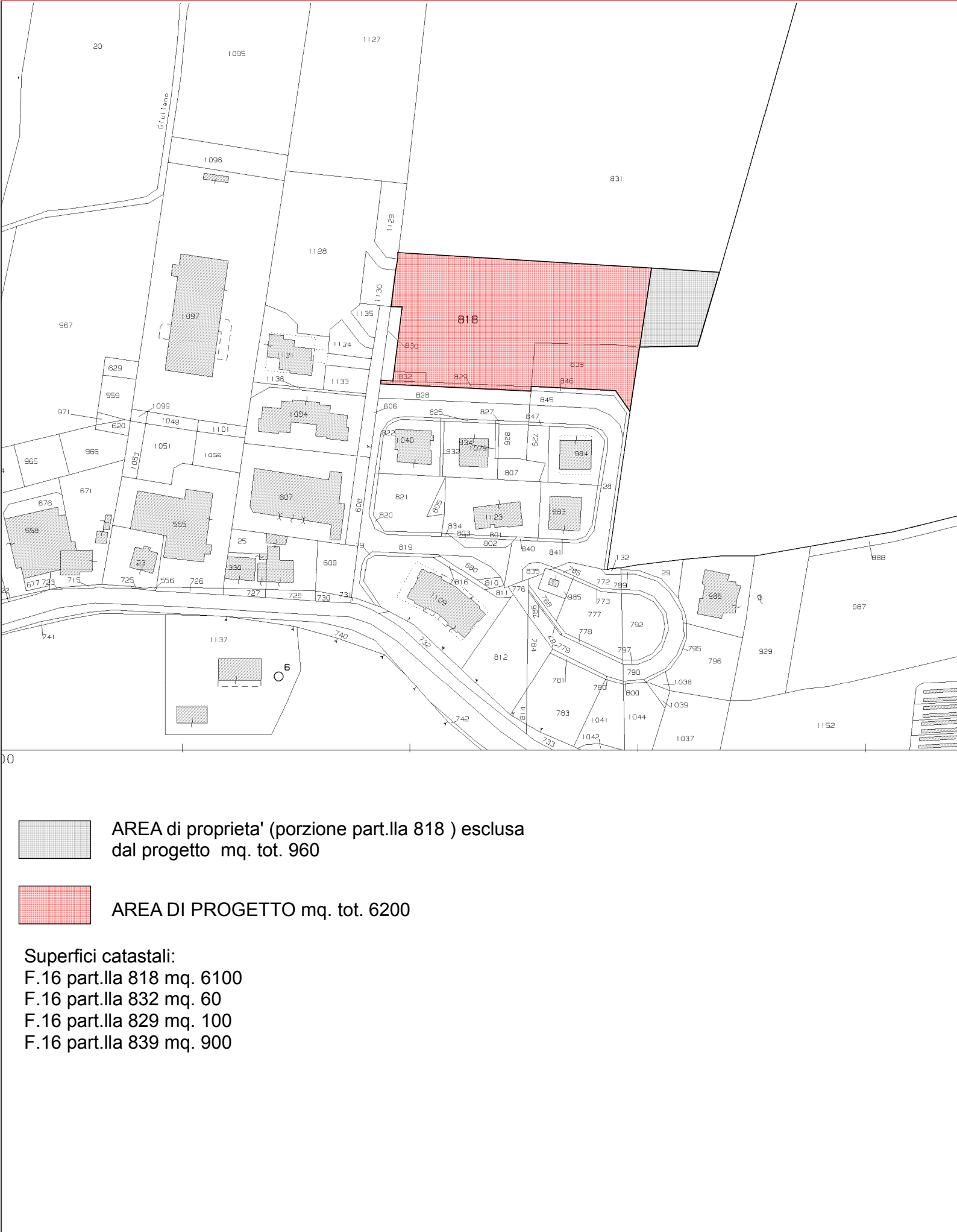
ESTRATTO di MAPPA (scala 1:2000)