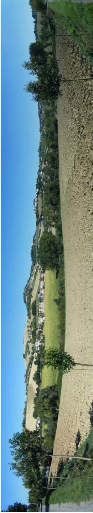
Vista panorâmica da terra